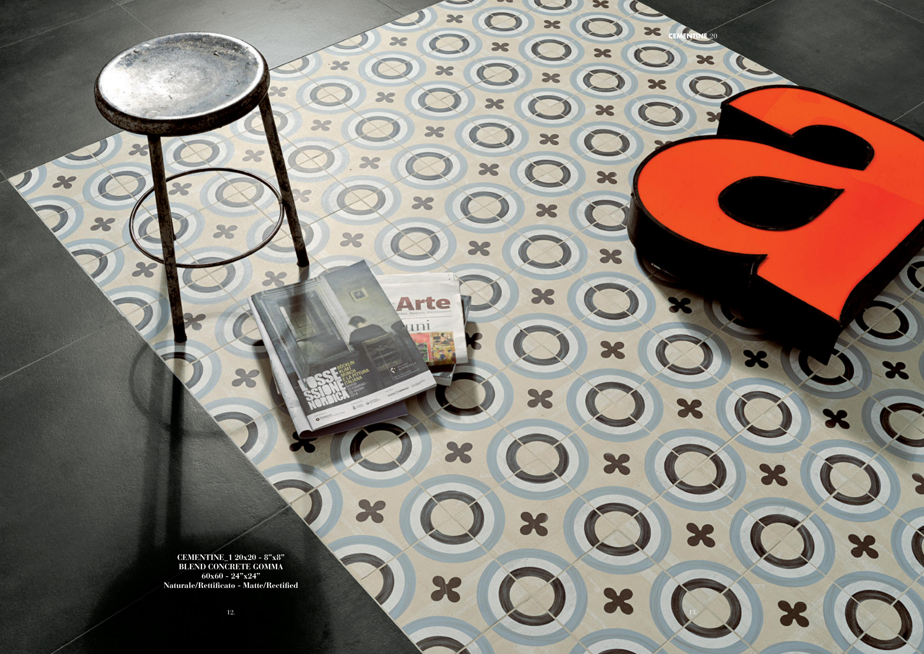
CEMENTINE_1 20x20 - 8"x8" BLEND CONCRETE GOMMA 60x60 - 24"x24" Naturale/Rettificato - Matte/Rectified