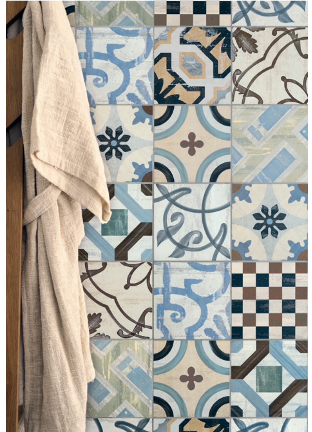
COLORS 20x20 - 8"x8" Naturale/Rettificato - Matte/Rectified