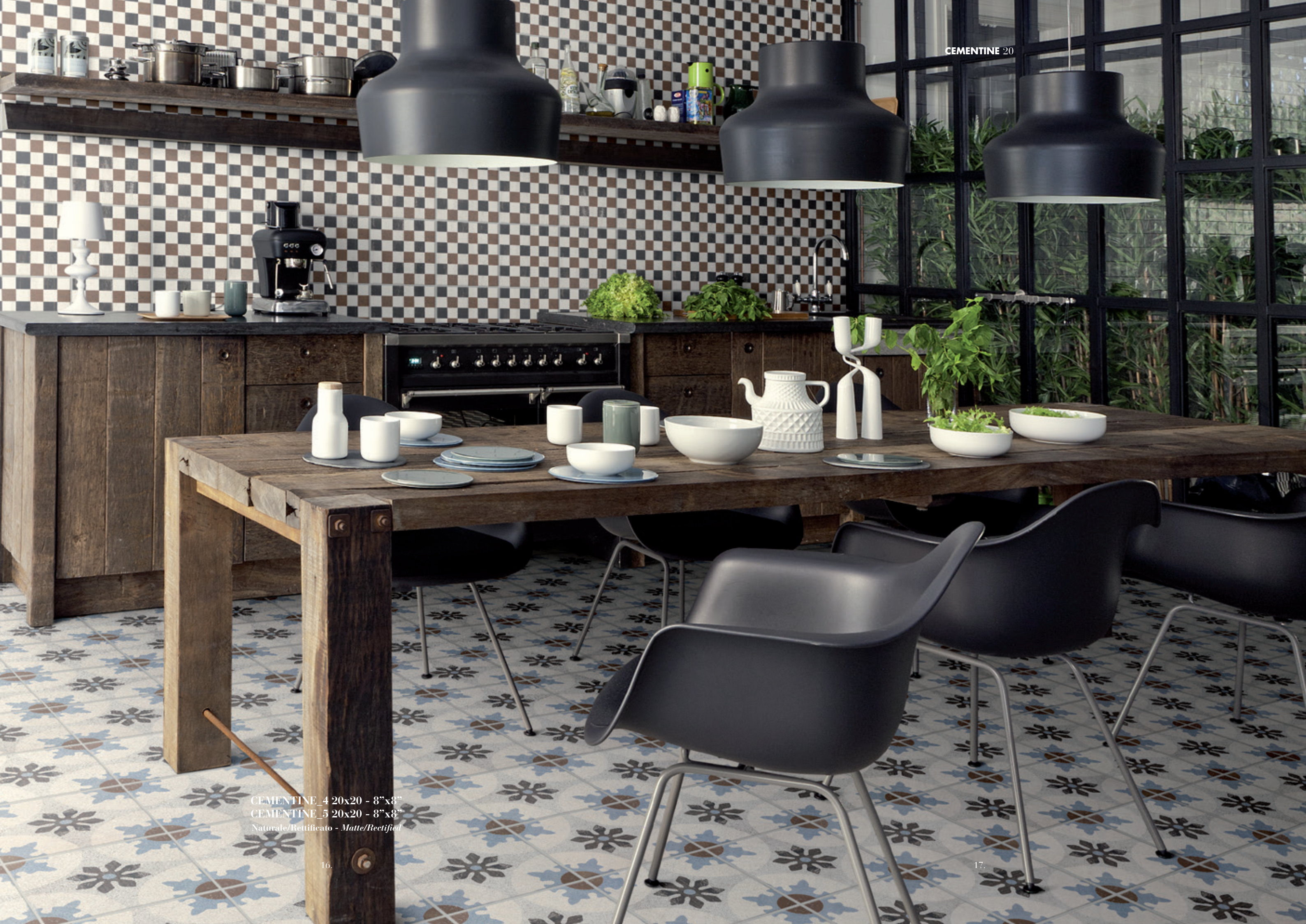
CEMENTINE_4 20x20 - 8"x8" CEMENTINE_5 20x20 - 8"x8" Naturale/Rettificato - Matte/Rectified