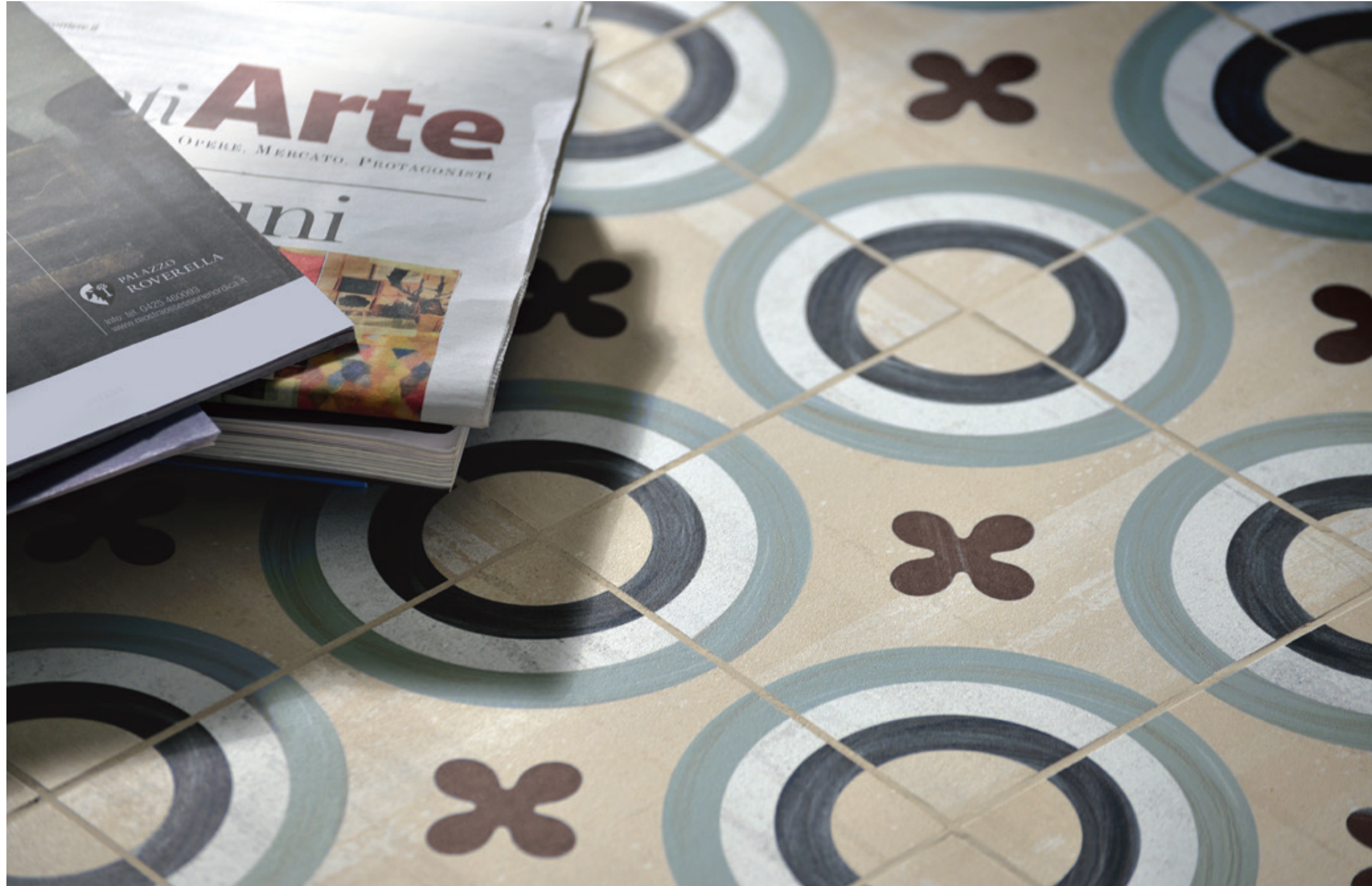
CEMENTINE_1 20x20 - 8"x8" Naturale/Rettificato - Matte/Rectified