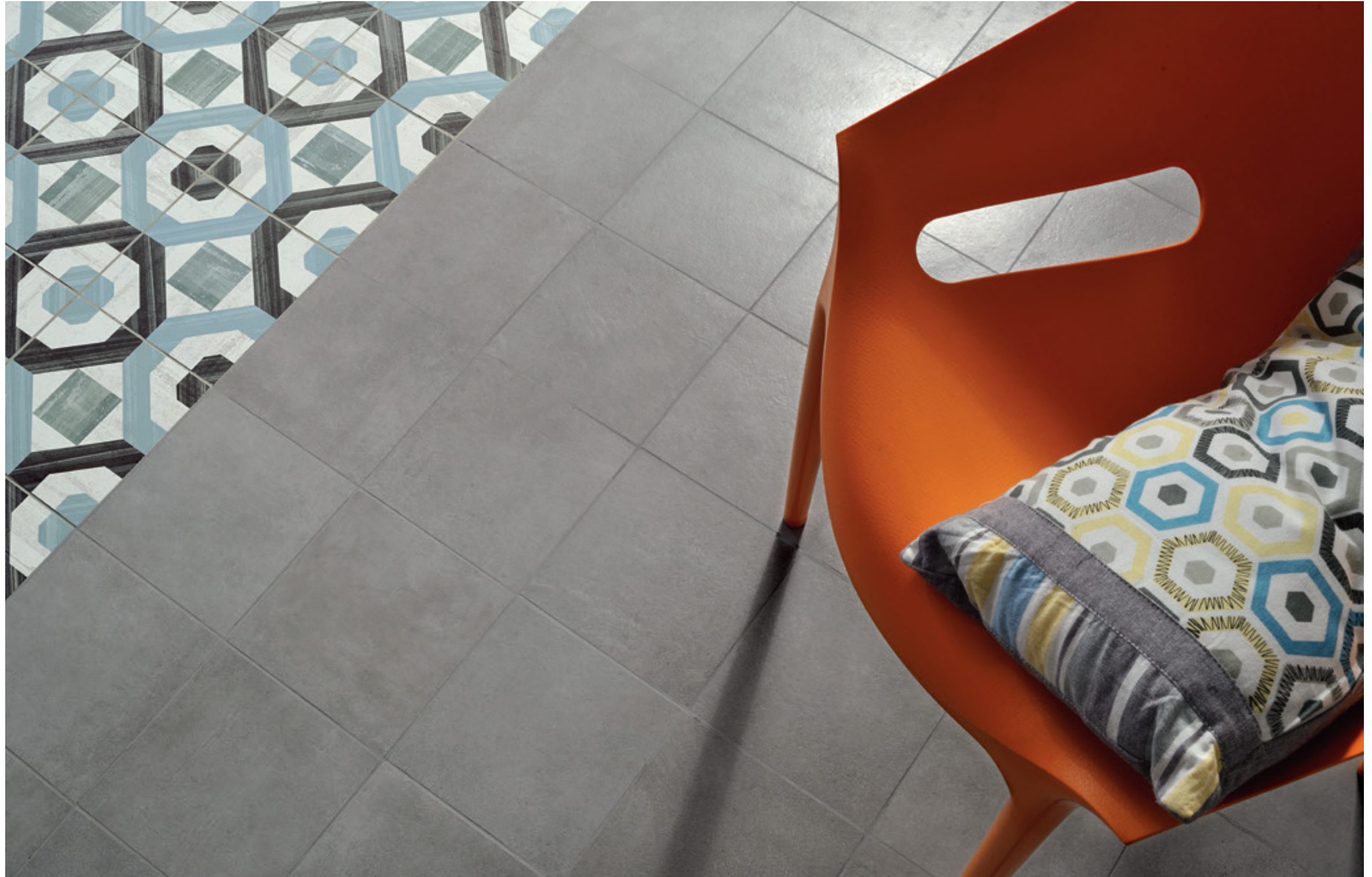
CEMENTINE_3 20x20 - 8"x8" BLEND CONCRETE GRIGIO 20x20 - 8"x8" Naturale/Rettificato - Matte/Rectified